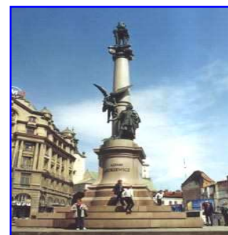
Pomnik Adama Mickiewicza